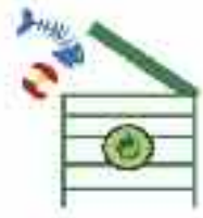
Présence de compost

La ville de BOHAIN met à disposition gratuitement des produits que les administrés peuvent retirer en mairie Information et retrait des produits du lundi au vendredi de 8h30 à 12h00 et de 13h30 à 17h30 tél : 03.23.07.55.55