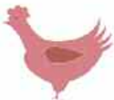
Elevage de volailles