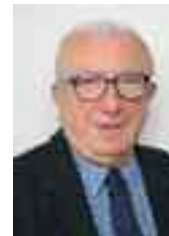
Gérard LEGRAND Communication