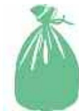
Présence de déchets