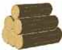
Présence de tas de bois